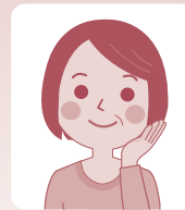
松川町 女性 50代

私は2回目の受講です。1回目は10年前になります。趣味の教室を始めることになりテキスト作りやご案内などパソコンはかかせないので習いたい!と思っていたらパソコン教室のチラシが入り思い切って電話しました。先生が穏やかな方なので何度聞いても優しく教えてくださるので安心して学べます。